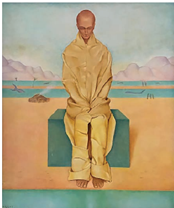
Arturo Nathan, L'esiliato , ( Autoritratto ), olio e tempera su cart one, cm 54 x 46, 1928. Collezione Barilla, Parma; Courtesy Galleria Torbandena, Trieste.