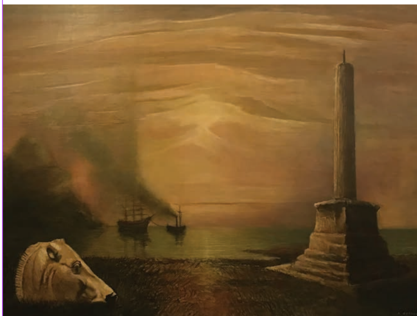
Arturo Nathan, Nave a rimorchio , olio su tavola, cm 65 x 90, 1934