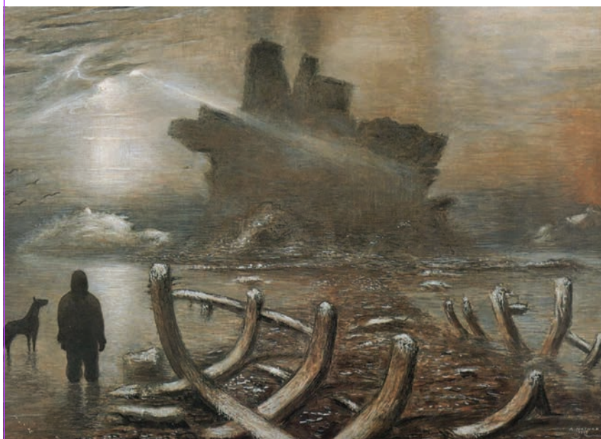
Arturo Nathan, Rupi vulcaniche , tempera su tavola, cm 65 x 90, 1933. Collezione privata