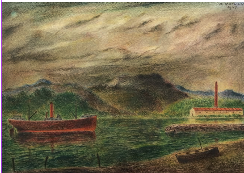
Arturo Nathan, Battello a vapore e fabbrica , matite colorate su cartoncino, cm 24 x 33, 1943.