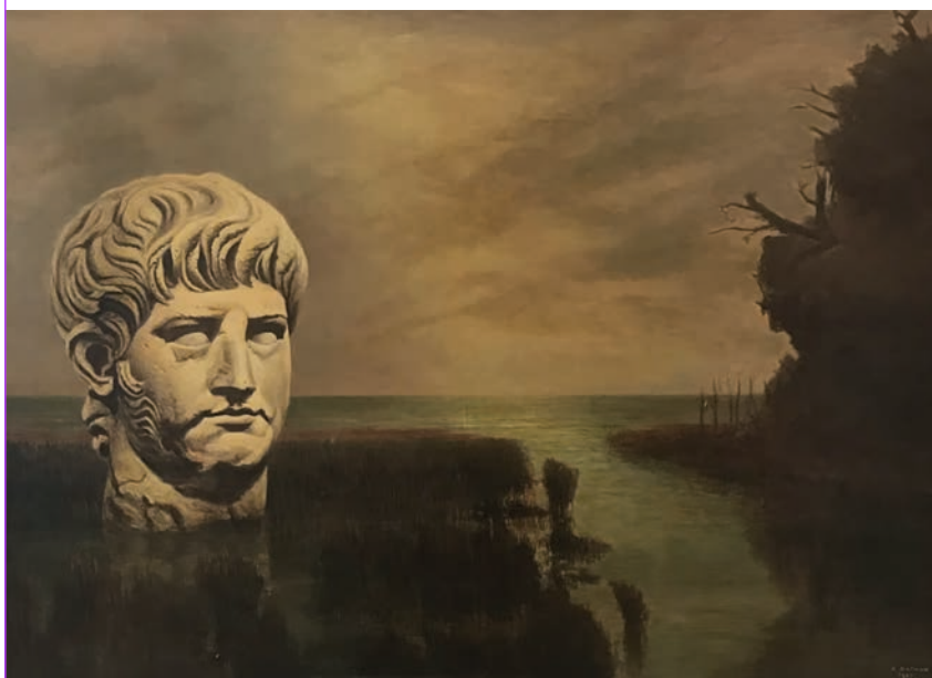
Arturo Nathan, Palude , olio su tavola, cm 65 x 90, 1937. Collezione eredi Emilio Jesi, Ginevra