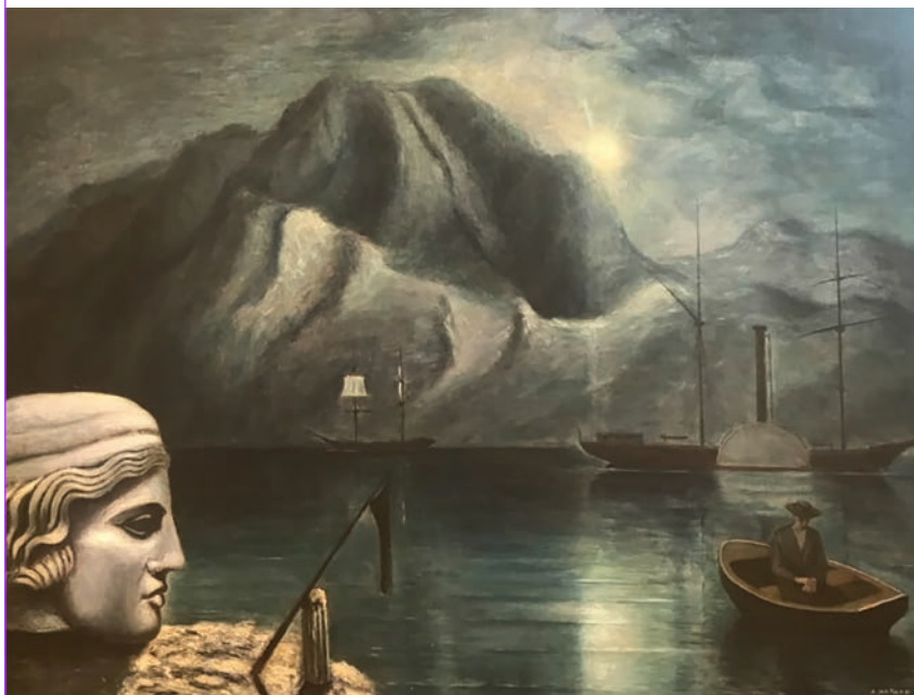
Arturo Nathan, Sortilegi lunari , olio su tavola, cm 65 x 90, 1933.