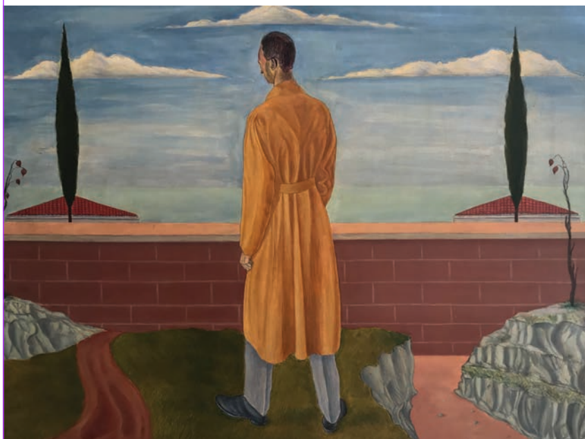
Arturo Nathan, Pomeriggio d'autunno , olio su tavola, cm 46 x 54, 1925.