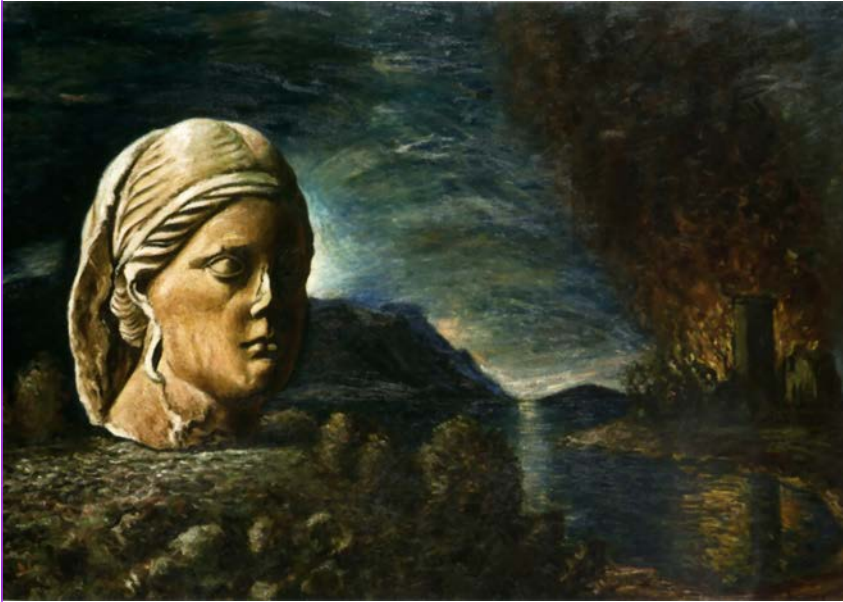
Arturo Nathan, L'incendiario , olio su tavola, cm 65 x 90, 1931. Museo dell'Ermitage, San Pietroburgo