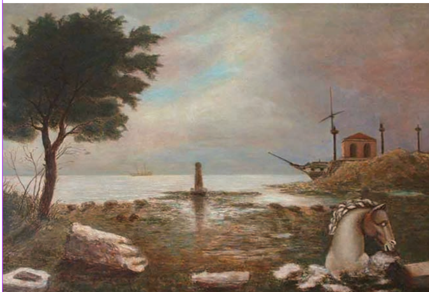
Arturo Nathan, Spiaggia con frammenti , olio su tavola, cm 65 x 90, 1934. Collezione Astaldi Zanini