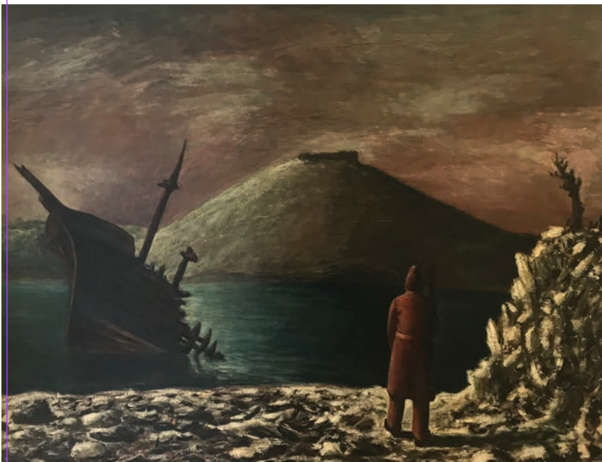
Arturo Nathan, La sentinella , olio su tavola, cm 65 x 90, 1931. Collezione Kraus, Trieste