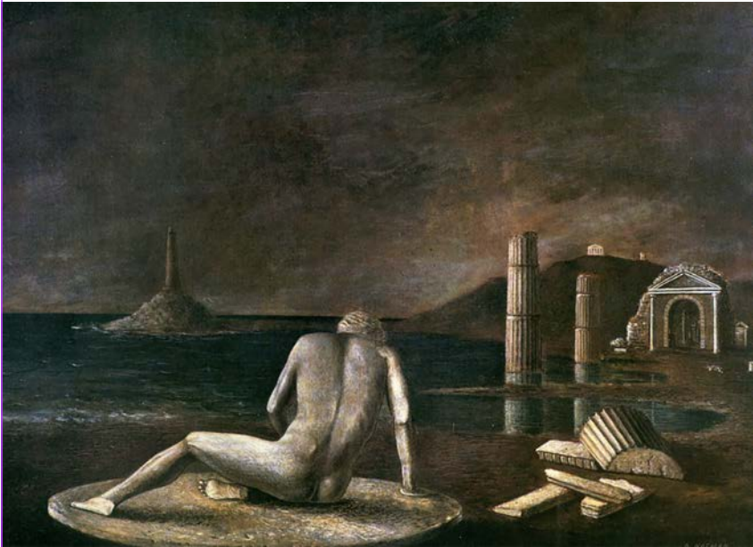
Arturo Nathan, Spiaggia abbandonata , olio su tavola, cm 70 x 100, 1930. Museo del Novecento, Milano