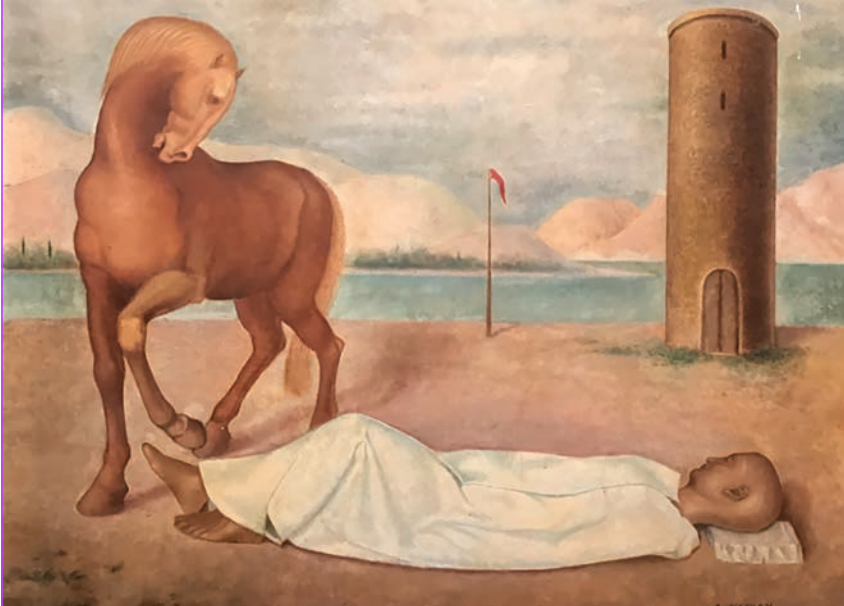
Arturo Nathan, L'abbandonato , olio su tela, cm 88 x 98; (1928. Collezione privata, Milano